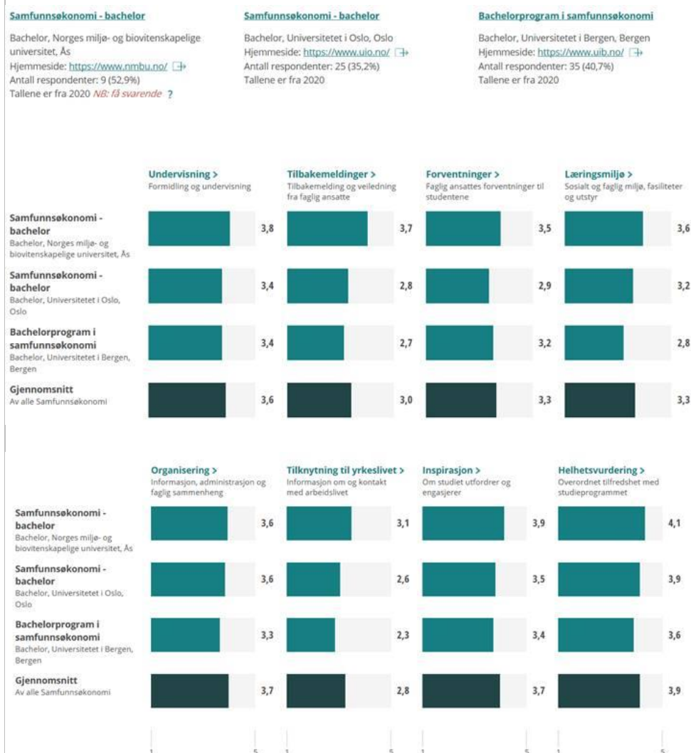
Tabell 4: Studenttilfredshet sammenlignet med samfunnsøkonomistudier på andre læresteder.

Karakterer som varierer mellom 3,1 og 3,9 på seks av kategoriene tilsier også at det er klart rom for forbedringer. I fjor fikk vi svakest karakter (3,1) på tilbakemelding og veiledning fra faglige ansatte. Denne kategorien scoret vi betydelig bedre på i år. I 2020 var det «tilknytning til yrkeslivet» som kom dårligst ut. Dette resultatet deler vi med de andre universitetene.