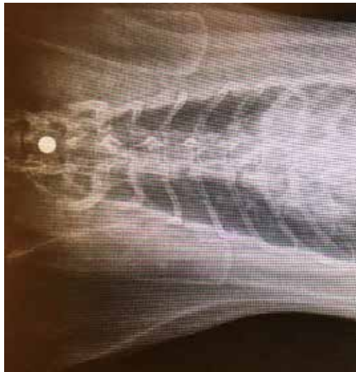
Røntgen i to plan av katt med ammunisjon i toraks.