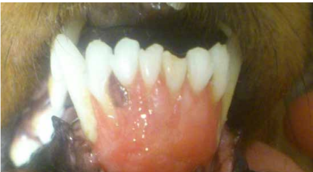
Brukket tann etter stump vold.

En studie sammenlignet frakturer hos hunder etter hhv. påført skade og uhell (Tong, 2014). Hunder utsatt for mishandling hadde høyere sannsynlighet for flere frakturer (i snitt 2.6 frakturer) enn hunder utsatt for uhell (i snitt 1.8 frakturer). De mest vanlige lokasjonene av frakturer etter mishandling var radius, ulna, femur og avulsjonsfraktur av tuberositas tibiae. Tverrfrakturer forekom i denne studien oftere etter vold (71 %) enn etter uhell (46 %). Hos mennesker er det kjent at spark og slag har en tendens til å resultere i tverrfrakturer.