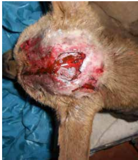
Hund med splintringsbrudd i kraniet etter kraftig stump vold med hammer. Bildet til venstre er tatt før undersøkelse.