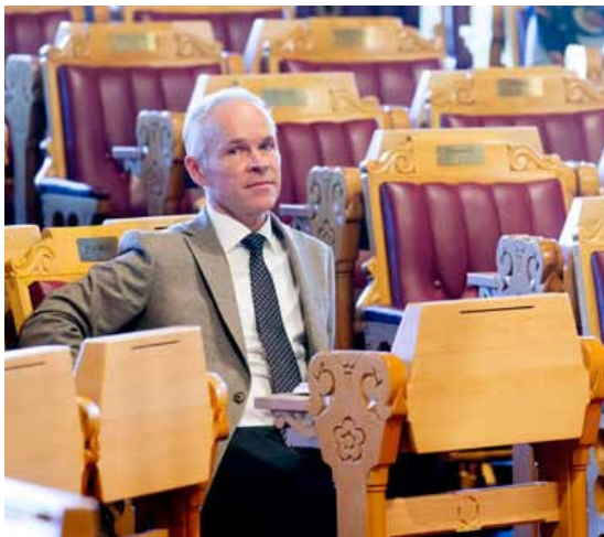
Lytter: Departementet legger stor vekt på Ombudsmannens uttalelser, skriver kommunal- og moderniseringsminister Jan Tore Sanner.

Jan Tore Sanner Kommunal- og moderniseringsminister