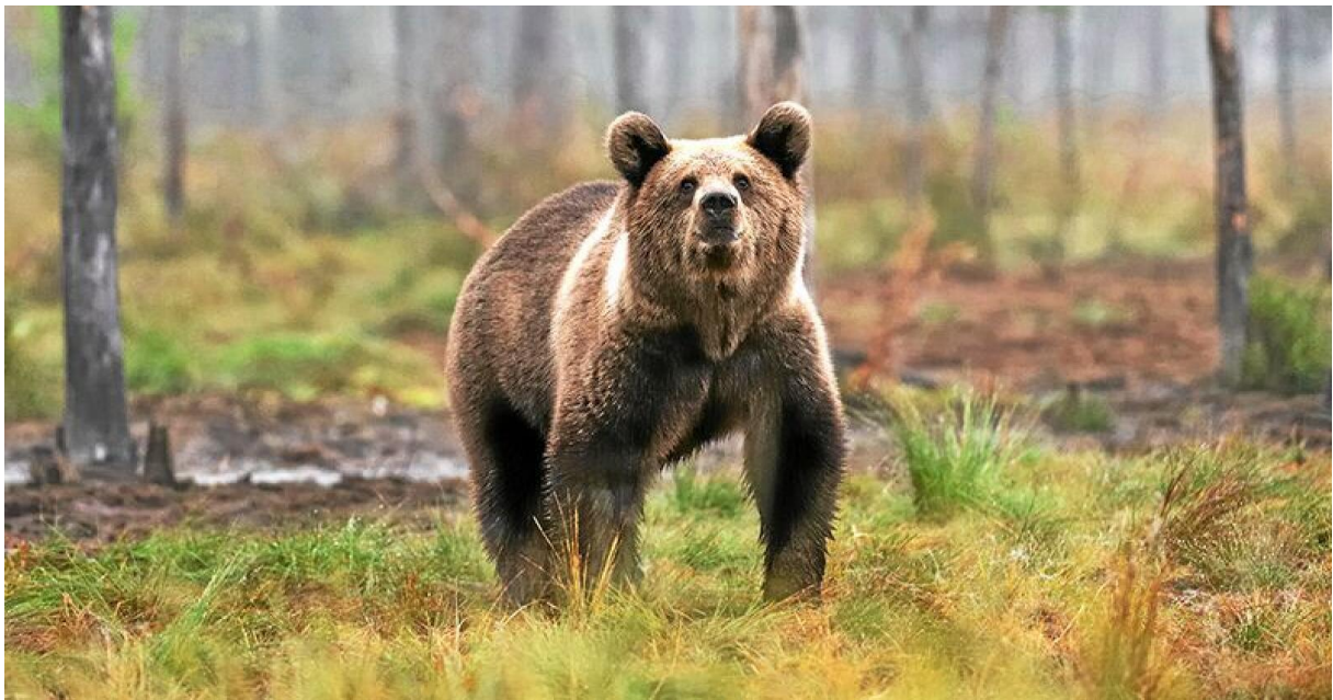
Figur 1: Illustrasjonsbilde av brunbjørn.