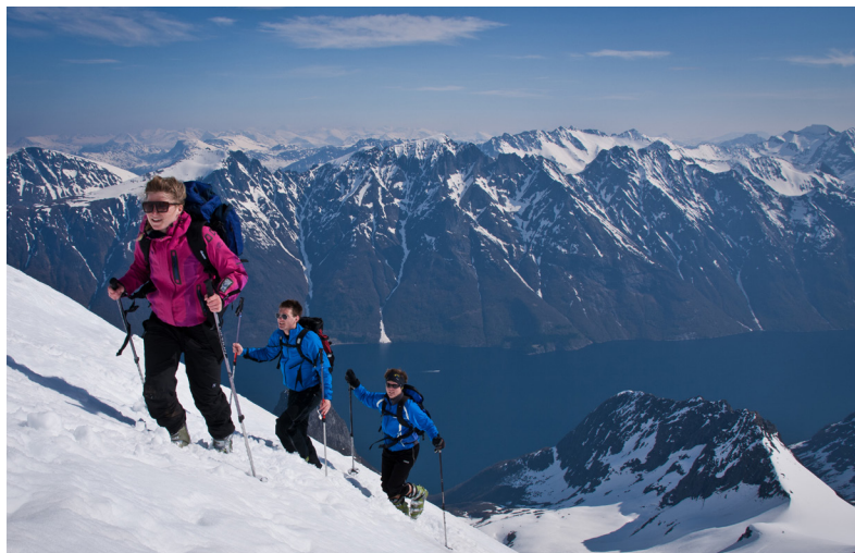
Utstyrsrevolusjonen bidrar til vekst i krevende aktiviteter ved å gjøre naturområder mer tilgjengelige og tryggere.

Klimaendringer Varmere og mer snøfattige vintre vil påvirke lavtliggende skidestinasjoner i nord negativt og øke presset på mer snøsikre, høytliggende områder. Isbreene trekker seg tilbake og deres økonomiske verdier knyttet til naturbaserte aktiviteter, som brevandring og skitur, reduseres.