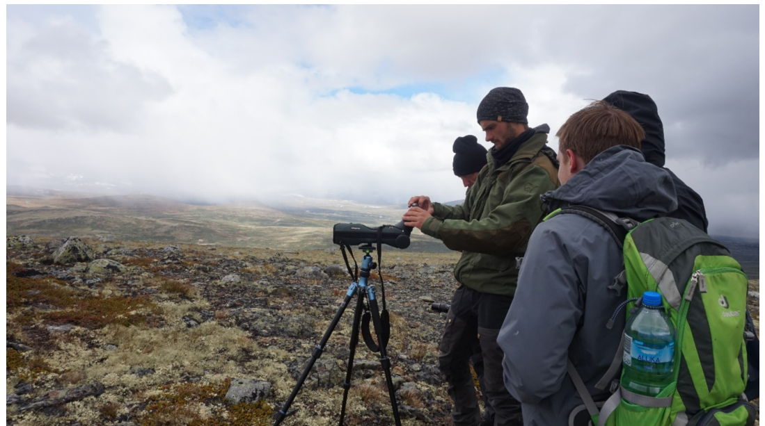
Guiden hjelper deltakerne på moskussafari å ta bilder gjennom et teleskop

Det er ønskelig å undersøke hvordan disse faktorene påvirker lojalitet blant viltkikkingssturister slik at produktutvikling og markedsføring av viltkikkingsopplevelser kan tilpasses markedet. Denne problemstillingen vil undersøkes innen utgangen av prosjektet.