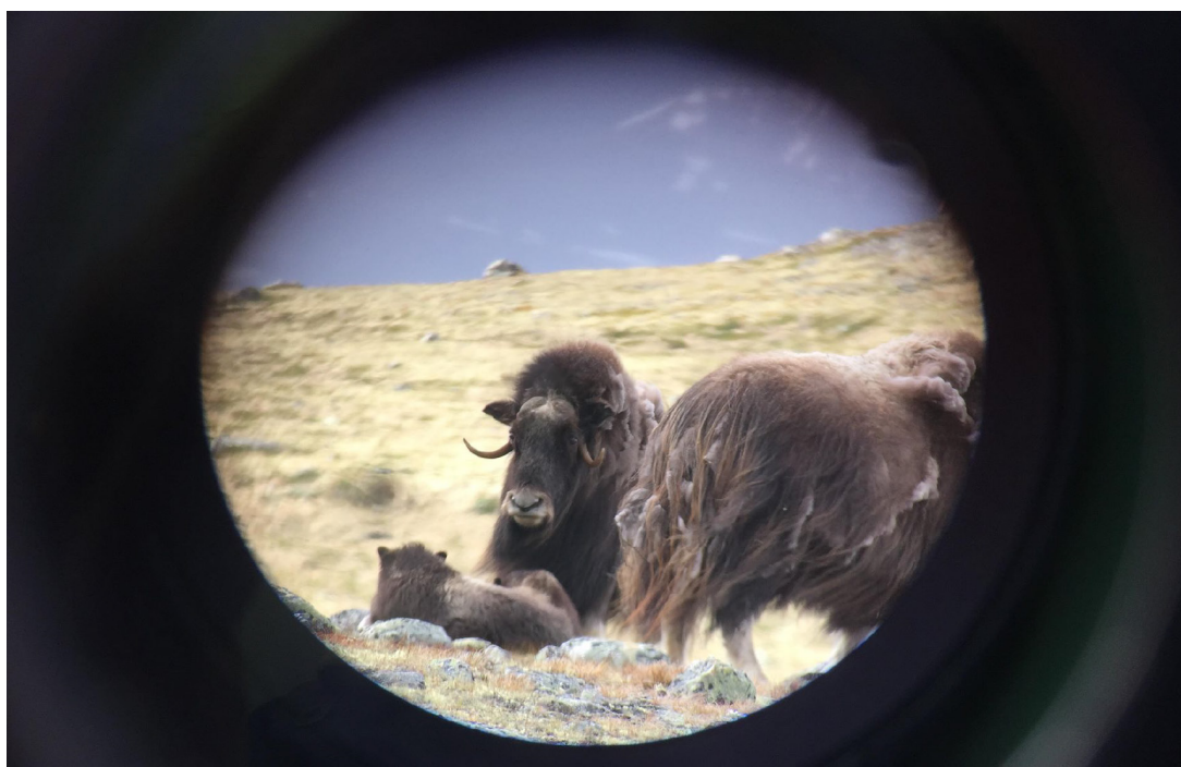
Bilde tatt gjennom teleskopet til guiden)

Viltkickingsturisme er reiseliv som er organisert og gjøres for å se på ville dyr i en naturlig situasjon. Det er en av de nisjene innenfor naturbasert reiseliv som vokser raskest både internasjonalt og i Norge. Samtidig er det forsket relativt lite på nisjen sammenlignet med andre former for naturbasert reiseliv i norsk sammenheng.