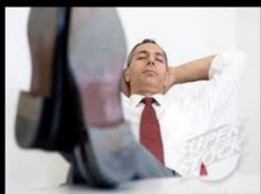
What my friends think I do