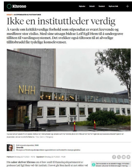
(NHH: November, 2023) (NTNU: Februar, 2024)