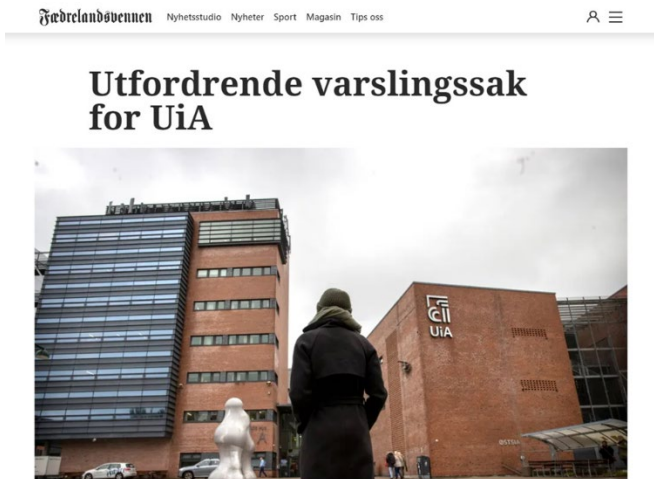
(UiA: Oktober, 2023)