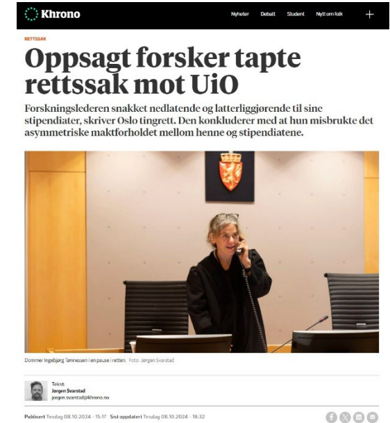
(UiO: Oktober, 2024)