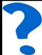
What society thinks I do