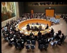
What I think I do