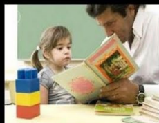
What my mother thinks I do