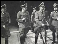
What students and academic staff think I do