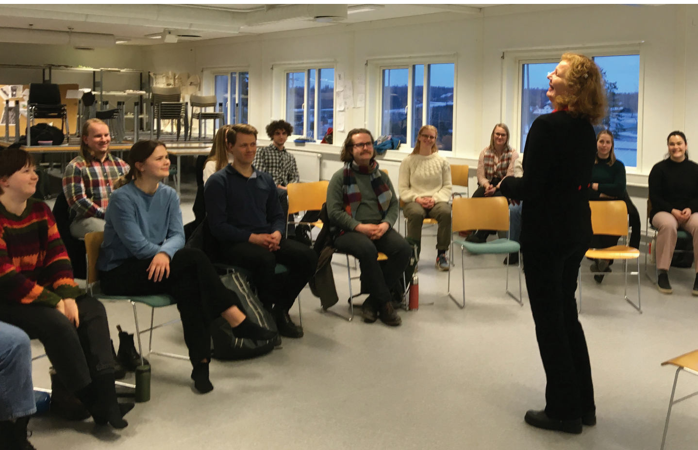
Bilde: Undervisning med erfaren skuespiller som del av Modul 2 Prosessledelse

“Etter å ha gjennomført et praktisk medvirkningsopplegg er det interessant å se tilbake på noen av de spørsmålene som ble diskutert i modul én og to av kurset. Særlig interessant for oss er det å spørre oss selv om medvirkningen vi har gjennomført har virket. Som diskutert tidligere er det etter vårt syn liten tvil om at medvirkningsopplegget har vært vellykket, og at både deltakerne og kommunen har nytteverdi av gjennomføringen og innspillene som er samlet