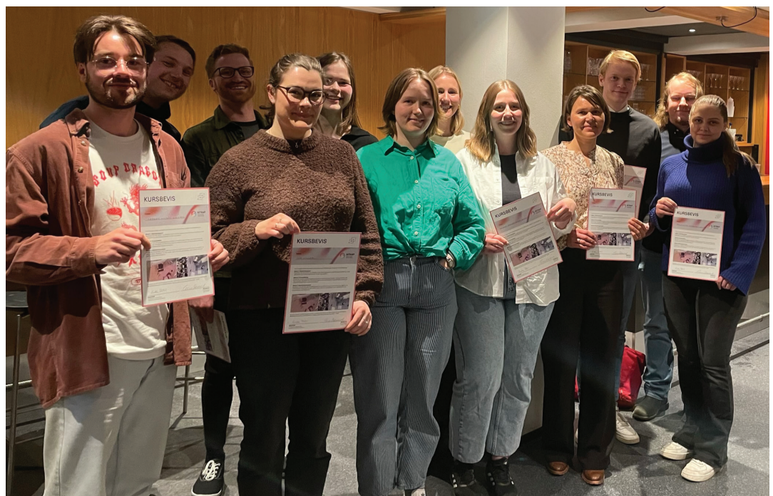
Bilder: Medvirkning som virker - Studentledet innspillsmøte/konferanse og Fight Club - april 2023

Studenter som har gjennomført hele undervisningsopplegg mottok et eget kursbevis som beskriver kompetansen.