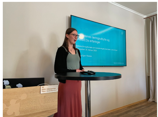
Bilder: Innspillmøte med undervisere og studenter fra Fakultet for landskap og samfunn, februar 2023