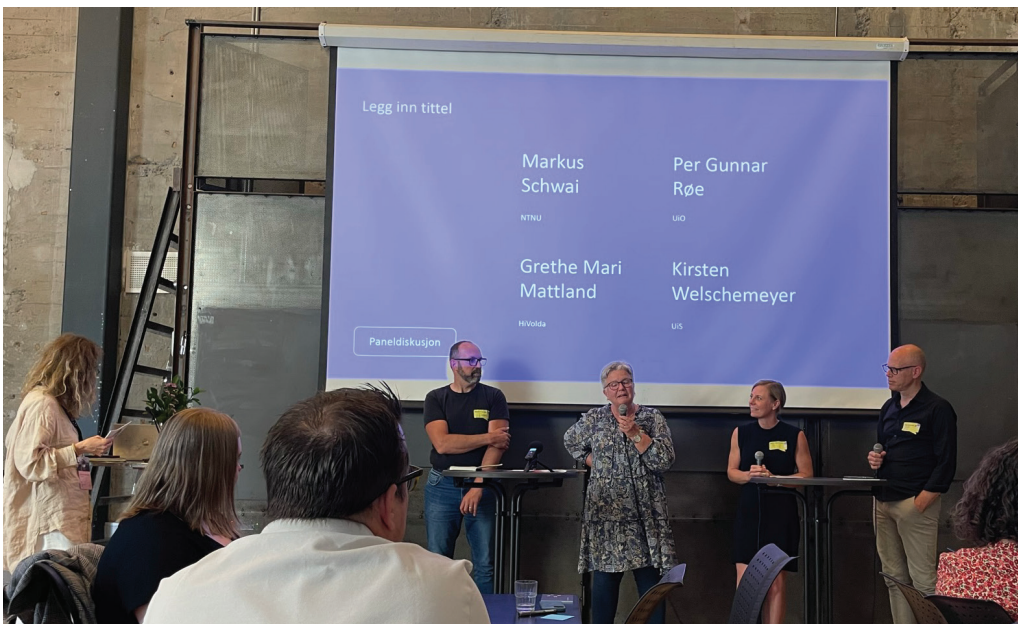
Bilde: Medvirkningssirkuset 2023 Undervisere fra andre læresteder forteller om sine erfaringer om medvirkningskompetanse