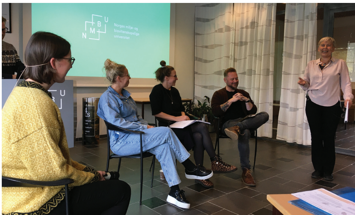
Bilde: SITRAPs årskonferanse 2021